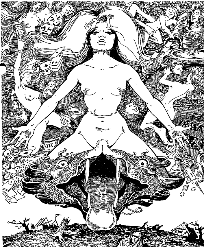
DIE BABYLONISCHE HURE DEGWITZ 81

Serie: „Die babylonische Hure“ ist das zweite Blatt einer Serie von fünf Kupferstichen zu Themen aus der mittelalterlichen Mystik. Die nachfolgenden Motive werden im Halbjahresabstand verlegt. Alle Käufer dieses Stiches werden über die Fortführung der Serie weiter unterrichtet.