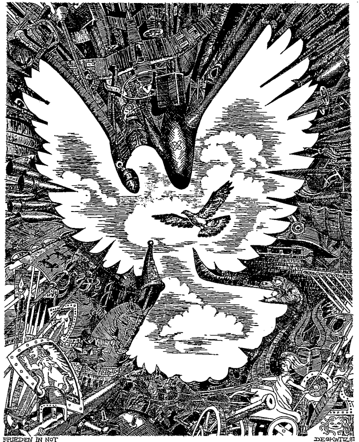
FRIEDEN IN NOT DEGWITZ 81

Die Aufsteiger · Druckplatte etwa 24 cm x 25 cm · Auflage 300 · DM 150,-