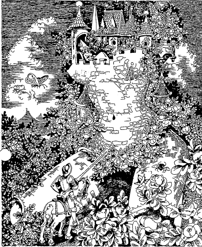
Dornröschen · Druckplatte etwa 23,5 cm x 29 cm · Auflage 300 · DM 150,-