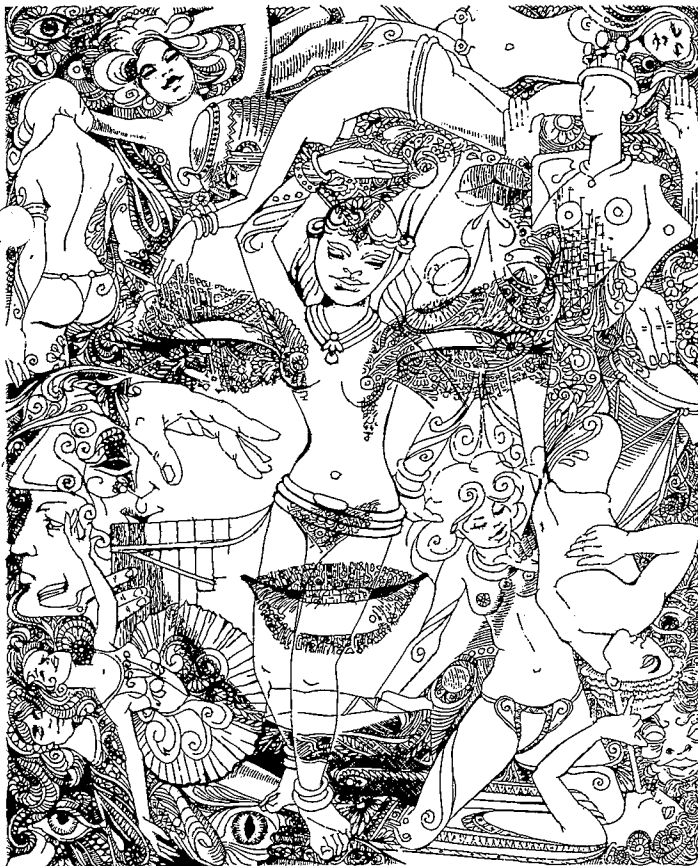
Terpsichore · Druckplatte etwa 24 cm x 29 cm · Auflage 300 · DM 150,-